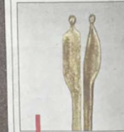
Sculpture de bronze de Liselotte Andersen, "ensemble".

Entre calligraphie, illustration, poésie, les dessins de l'artiste naud Polette proposent un message dans un univers lité presque magique et mesquie. De son côté, C laisse ses souvenirs et ses p guider se spontanément. Et tant d'ombre et de couleur ajoute une touche d'inconscient faillir douceur et poésie